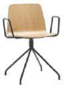
Steel swivel base Base giratoria de acero + arms / brazos