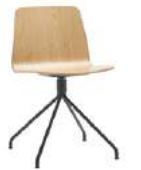
Steel swivel base Base giratoria de acero