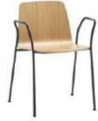
4 legs armchair Sillón 4 patas