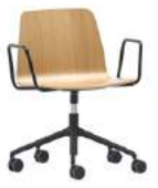
Aluminum swivel base Base giratoria de aluminio + arms / brazos + casters / ruedas + gas lift / elevación gas