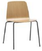
4 leg Silla 4 patas