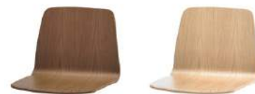
— Walnut shell Carcasa de nogal