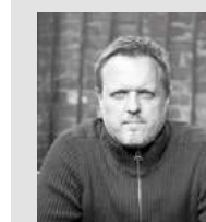
VARYA WOOD Designed in London by Simon Pengelly www.simonpengelly.com

Patas de madera: están fabricadas con roble macizo y están disponibles en todos los colores de roble del muestrario de acabados INCLASS.