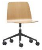
Aluminum swivel base Base giratoria de aluminio + casters / ruedas + gas lift / elevación gas