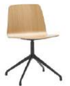
Aluminum swivel base Base giratoria de aluminio