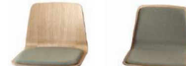
— Upholstered seat pad Asiento tapizado