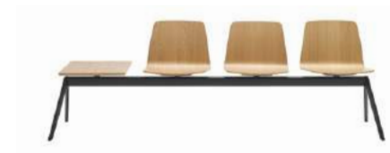
Bench 2-5 seater Banco 2-5 plazas