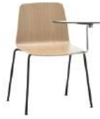
4 leg 4 patas + writing tablet / pala escritura