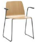
Sled base armchair Sillón pie de varilla