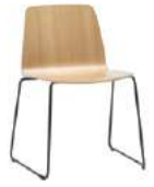
Sled base Pie de varilla