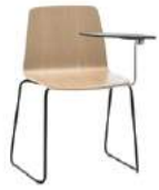
Sled base Pie de varilla + writing tablet / pala escritura