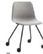
4 leg base Base 4 patas + casters / ruedas