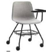
4 leg base Base 4 patas + casters / ruedas + XL writing tablet / pala escritura XL