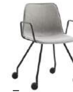
4 leg base Base 4 patas + arms / brazos + casters / ruedas