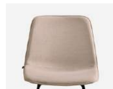
Plain upholstery Tapicería lisa