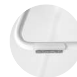
Felt glides for rod Tacos fieltro para varilla