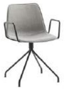
Steel swivel base Base giratoria de acero + arms / brazos