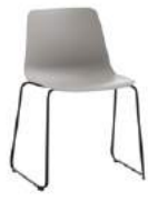
Sled base Pie de varilla