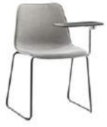
Sled base writing tablet Pie de varilla pala escritura