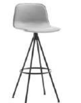
Swivel base stool Taburete base giratoria high / alto