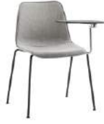
4 leg writing tablet 4 patas pala escritura