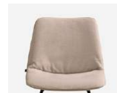
Soft fibre upholstery Tapicería fibra suave