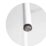
Felt glides for tube Tacos fieltro para tubo