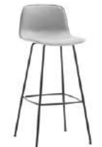
4 leg base stool Taburete 4 patas high / alto