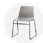
Reinforced sled base Base de varilla reforzada