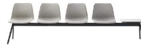
Bench 2-5 seater Banco 2-5 plazas