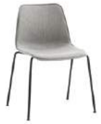
4 leg Silla 4 patas