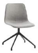
Aluminum swivel base Base giratoria de aluminio