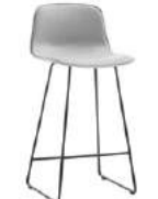
Sled base stool Taburete varilla medium / medio