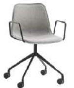
Aluminum swivel base Base giratoria de aluminio + arms / brazos + casters / ruedas