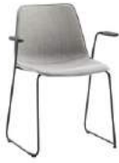
Sled base armchair Sillón pie de varilla