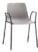
4 leg armchair Sillón 4 patas