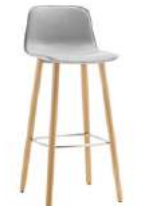
4 wooden leg base stool Taburete 4 patas madera high / alto