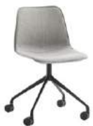
Aluminum swivel base Base giratoria de aluminio + casters / ruedas