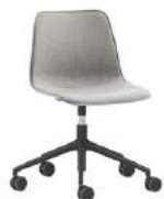
Aluminum swivel base Base giratoria de aluminio + casters / ruedas + gas lift / elevación gas