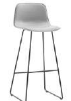
Sled base stool Taburete varilla high / alto