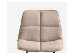
Quilted upholstery Tapizado quilted