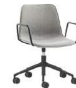
Aluminum swivel base Base giratoria de aluminio + arms / brazos + casters / ruedas + gas lift / elevación gas