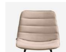
Horizontal stitching Costuras horizontales