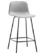
4 leg base stool Taburete 4 patas medium / medio