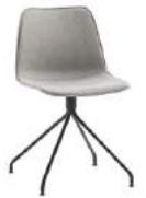
Steel swivel base Base giratoria de acero