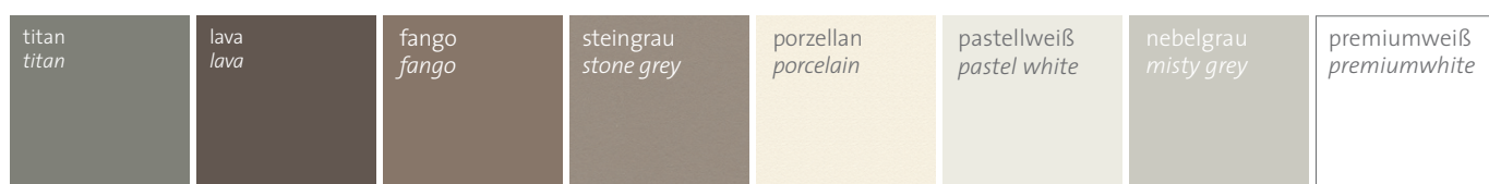
Uni Dekor (Auswahl)