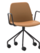
Steel swivel base Base giratoria de acero + metal arms / brazos metálicos + casters / ruedas