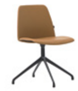
Aluminum swivel base Base giratoria de aluminio