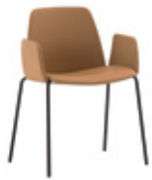
4 leg armchair Sillón 4 patas + upholstered arms / brazos tapizados