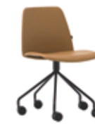
Steel swivel base Base giratoria de acero + casters / ruedas