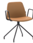
Steel swivel base Base giratoria de acero + metal arms / brazos metálicos