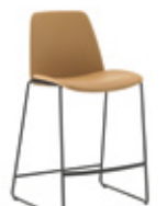
Sled base stool Taburete base varilla medium / medio