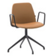
Aluminum swivel base Base giratoria de aluminio + metal arms / brazos metálicos