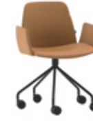
Steel swivel base Base giratoria de acero + upholstered arms / brazos tapizados + casters / ruedas