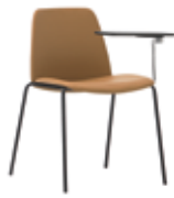
4 leg 4 patas + writing tablet / pala escritura