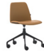
Aluminum swivel base Base giratoria de aluminio + casters / ruedas