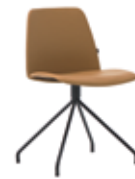
Steel swivel base Base giratoria de acero