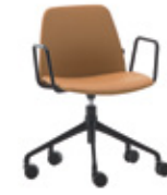
Aluminum swivel base Base giratoria de aluminio + metal arms / brazos metálicos + casters / ruedas