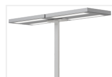
Free-F GR Doppelkopf- Variante