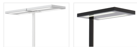
Free-F WH Doppelkopf- Variante