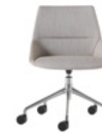
— Aluminium swivel Giratoria de aluminio + casters / ruedas