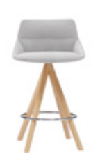
— Wooden swivel base Base giratoria madera medium / medio