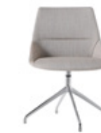
— Aluminium swivel base Base giratoria de aluminio