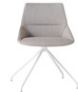
— Trestle swivel base Base giratoria piramidal