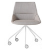
— Trestle swivel base Base giratoria piramidal + casters / ruedas