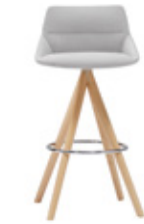
— Wooden swivel base Base giratoria madera high / alto