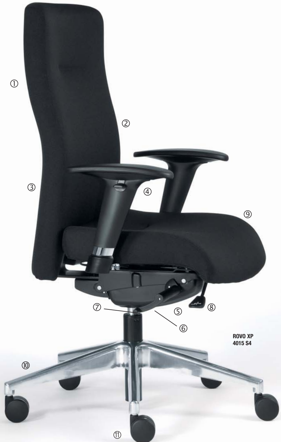
ROVO XP 4015 S4

⑪ Doppelrollen - gebremst - für Teppichboden (Standard) - für Hartboden (Option)